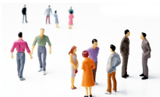
Figura 3 – Transformação cultural e o relacionamento entre as pessoas.

Mas, para que haja uma evolução de fato da instituição, é necessário que ela passe por uma mudança integral. Nesse sentido, Barrett (2009), enfatiza que a transformação cultural somente terá sucesso se a equipe de liderança da organização estiver devidamente comprometida com esses objetivos.