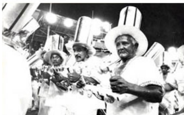
Figura 1 – Vila Maria Um Caso de Amor